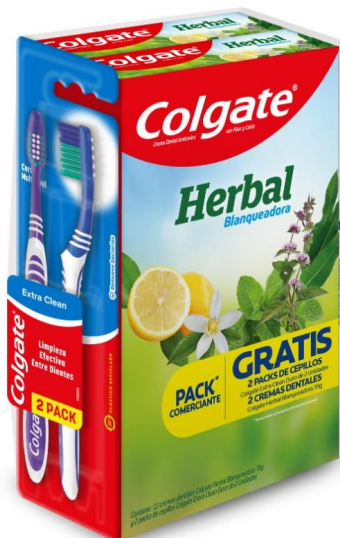
CRE DENT COLGATE HERBAL BLANQUEADORA