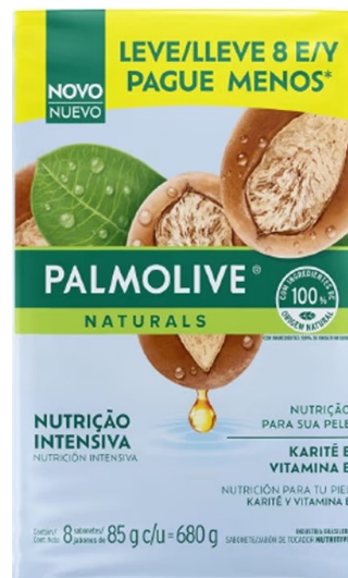
JABON PALM KARITE PACK