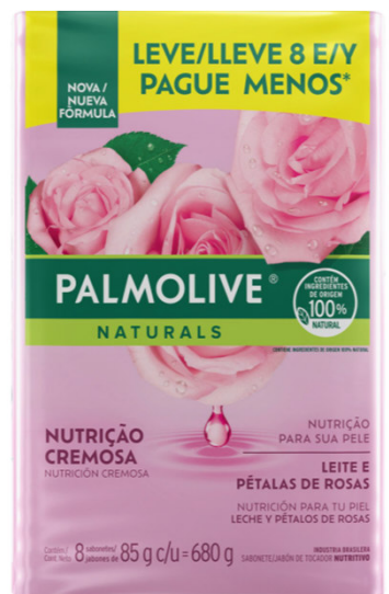
JABON PALM PETAL ROSA PACK