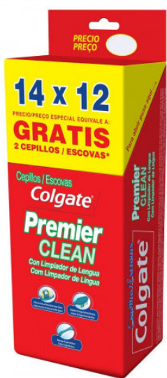
CEP DENT COLGATE PREMIER CLEAN