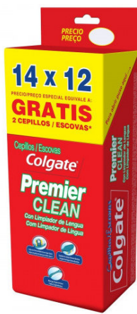
CEP DENT COLGATE PREMIER CLEAN 14 x 12 (6 u.) Cód. 7702010630514 Cód. int. 135