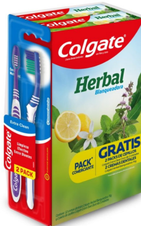
CRE DENT COLGATE HERBAL BLANQUEADORA 12x10 X70GS+2CEP Cód. 7509546695594 Cód. int. 6669