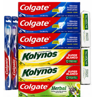
CRE DENT COLGATE PACK ALMACEN X70GS (4u) Cód. 7509546702384 Cód. int. 7175