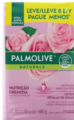
JABON PALM PETAL ROSA PACK 8 x 85GS Cód. 7509546657653 Cód. int. 7176