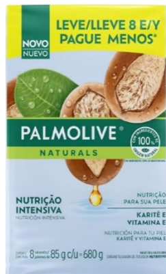
JABON PALM KARITE PACK 8 x 85GS Cód. 7891024042861 Cód. int. 6883